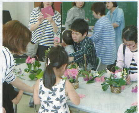
人気のフラワーアレンジメント