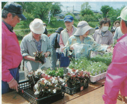
700鉢の花ポット苗を無料配布