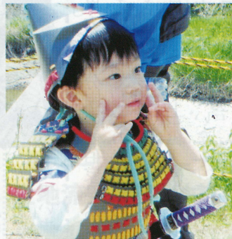
ちびっ子よろい武者誕生!