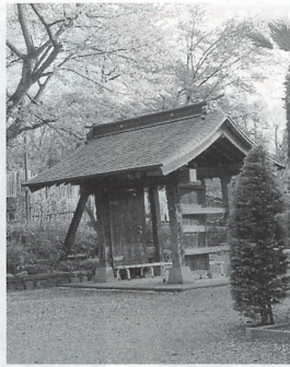
興福寺山門「横木の門」

たとの事、しかし殆ど枯れて、残るのはこの木1本となつてしまったそうです。 「興福寺」 参道を南に進むと陵南会館で、ここは旧皇室専用駅でした。 横のJR中央線に架かる跨線橋を渡り陵南中学校の東側を南に向かいます。その突き当たりに興福寺があります。曹洞宗聚林山千光院興福寺で開基は雨宮氏、山門が有名で設