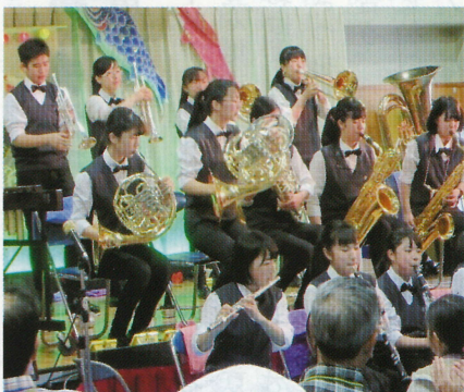
横山中学校吹奏楽部の演奏