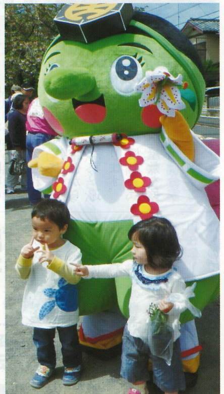
八王子の天狗キャラ「はっちお〜じ」も登場