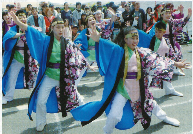
じょいそーらん四季舞の群舞