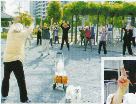
長房西団地の早朝ラジオ体操

長房地域住民協議会 八王子市長房町506-2 八王子市長房市民センター ☎042(664)4774 (公財)八王子市学園都市 文化ふれあい財団