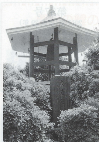
慈眼寺地蔵堂の鐘楼

その後、榎本家はハケ上に屋敷を拡げ、遠山家は分家の矢島家に譲りこの地を去ります。