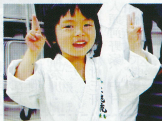
上地流空手道(沖縄 伝統武道)