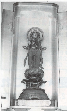
水崎観世音菩薩像

水崎は八王子城下で最も重要な土地で、氏照が創建した大善寺の末寺として永禄元年(1558年)に「龍泉寺」を開基しました。伽藍が焼失して衰退の時期があったようですが、