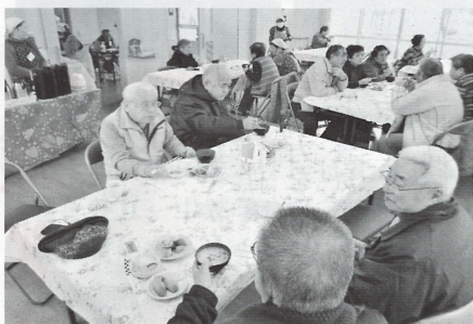
楽しい歓談のひとつ

龍泉寺の東側、横川との境目、道で三角になっているところが長房1番地です。私達の住所「長房町」は、八王子市住民基本台帳(平成29年9月)を見ると世帯数6737、総人口13732人と八王子で一番大きな町になっています。(平均的に1町2000人程度) 明治11年神奈川県南多摩郡下長房村、明治22年5村合併横山村、明治26年東京府、昭和30年横山村(人口6426人)は八王子市に