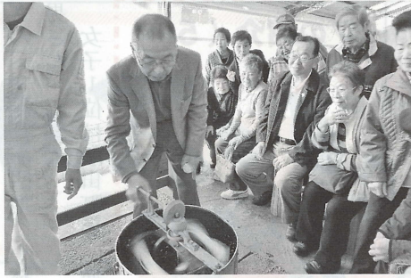
ハチミツを漉す遠心分離機